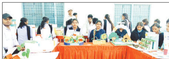
ऊर्जा संरक्षण, जल प्रबंधन, पर्यावरण संरक्षण, स्मार्ट तकनीक एवं

देखने को मिला। महाविद्यालय के साइंस बिल्डिंग में आयोजित इस प्रदर्शनी का उद्देश्य विद्यार्थियों में वैज्ञानिक सोच, नवाचार एवं शोध प्रवृत्ति को प्रोत्साहित करना रहा। प्रदर्शनी में छात्र छात्राओं ने भौतिकी, रसायन, जीवविज्ञान एवं पर्यावरण विज्ञान से संबंधित विविध कार्यशील मॉडल प्रस्तुत किए। कई मॉडलों में